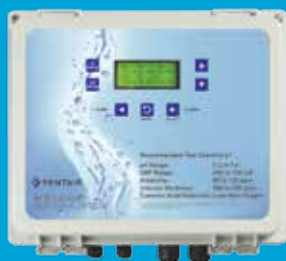
Contrôleur de produits chimiques IntelliChem

Le générateur IntelliChlor est le seul chlorateur au sel qui fournit autant de renseignements utiles. La teneur en sel, la propreté de la cellule, le volume de chlore et le débit de l'eau peuvent être consultés d'un seul coup d'œil.